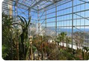
Le jardin exotique de Monaco 62 boulevard du Jardin Exotique