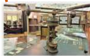
Musée des timbres et monnaies 11, terrasses de Fontvieille