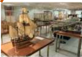
Musée naval Terrasses de Fontvieille