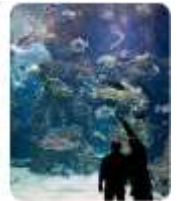
Musée océanographique Avenue Saint-Martin