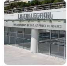
La Collection Automobile du Prince 54 route de la Piscine