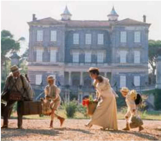
Le Château de ma mère , film de Yves Robert (1990), tourné au Château d'Astros.

(tlj 10h-17h30, 18h30 en été – visite guidée en 4X4 et dégustation 26.00 € sur réservation – site internet : https://www.chateauastros.com ).