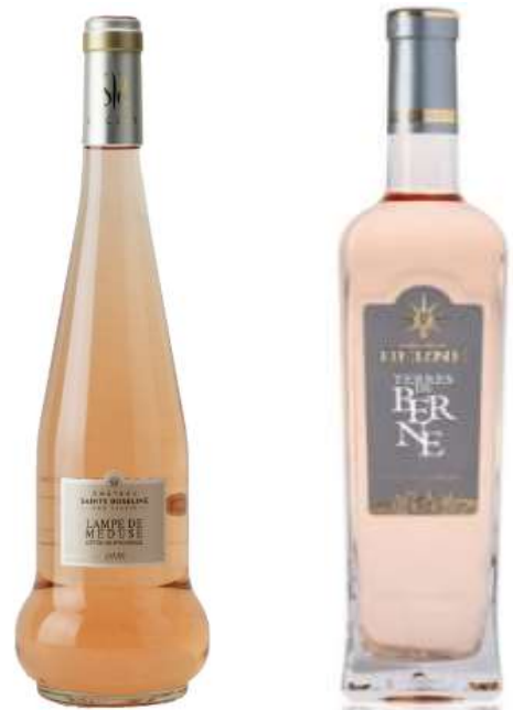
Lampe de méduse du Château Sainte-Roseline et Bouteille carrée , du Château de berne, deux bouteilles iconiques de la région.